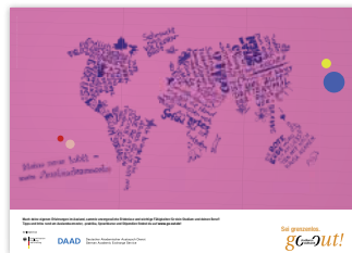
Plakat „Meine neue Welt – mein Auslandssemester“ DIN A1