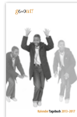
Kalendertagebuch „go out! 2013-2017“