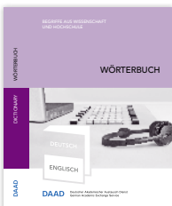
Wörterbuch „Englisch – Deutsch. Begriffe aus Hochschule und Wissenschaft“