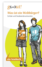
Lesebuch „go out! „Was ist ein Weltbürger?“ neu erschienen