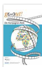
DVD „Die Kampagnen-Rolle“ 40 Spots und Kurzfilme von Hochschulen und DAAD