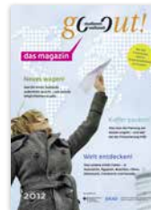
Magazin „go out! das magazin 2012“