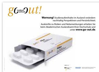
Plakat „Pillen gegen Fernweh“ DIN A1