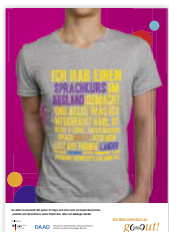
Plakat „T-Shirt Praktikum“ DIN A1