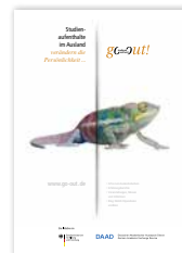
Plakat „Veränderung Chamäleon“ DIN A1 und DIN A2