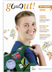
Magazin „go out! das magazin 2014“ neu erschienen