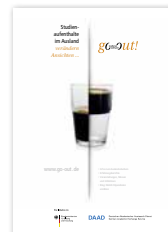
Plakat „Veränderung Glas“ DIN A1 und DIN A2