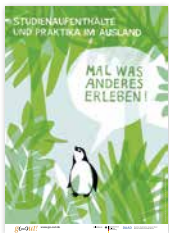
Plakat „Pinguin“ DIN A1