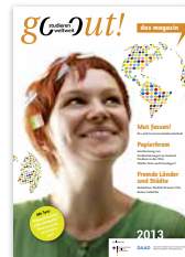
Magazin „go out! das magazin 2013“