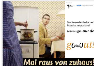
Plakat „Mal raus von zuhaus“ DIN A1