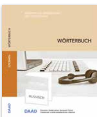
Wörterbuch „Russisch – Deutsch. Begriffe aus Hochschule und Wissenschaft“