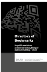
Broschüre „Directory of Bookmarks“ Wichtige www-Adressen mit QR-Code zum Studium weltweit neu erschienen