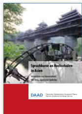
Broschüre „Sprachkurse an Hochschulen in Asien“ neu erschienen