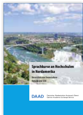
Broschüre „Sprachkurse an Hochschulen in Nordamerika“ neu erschienen