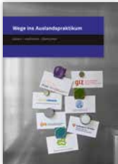
Broschüre „Wege ins Auslandspraktikum“ neu erschienen