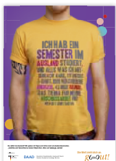
Plakat „T-Shirt Auslandssemester“ DIN A1