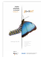
Plakat „Veränderung Schmetterling“ DIN A1 und DIN A2