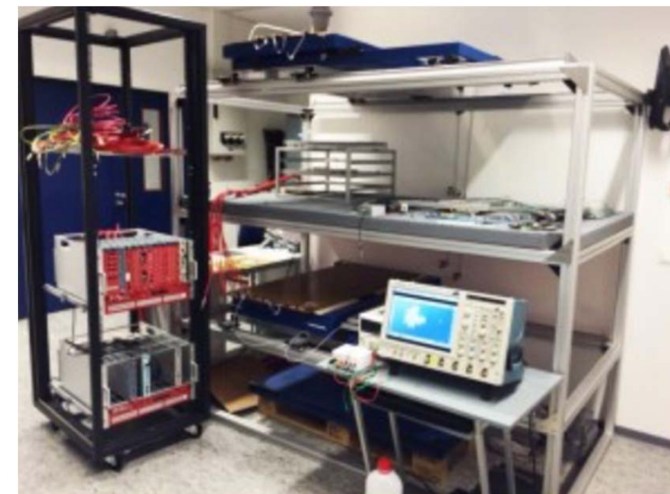
Teststand für kosmische Myonen