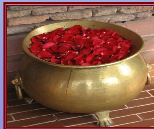
An einer Raststätte in Hariyana, Indien (2008)