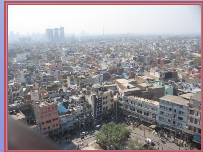
Blick über Old Delhi nach New Delhi, Indien (2008)