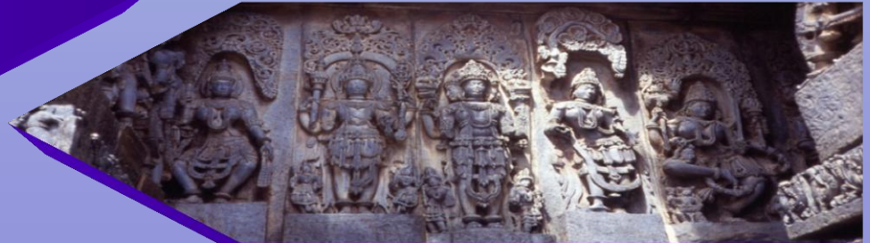
Hoysaleswara-Tempel, Halebid, Karnataka, Indien (1991)