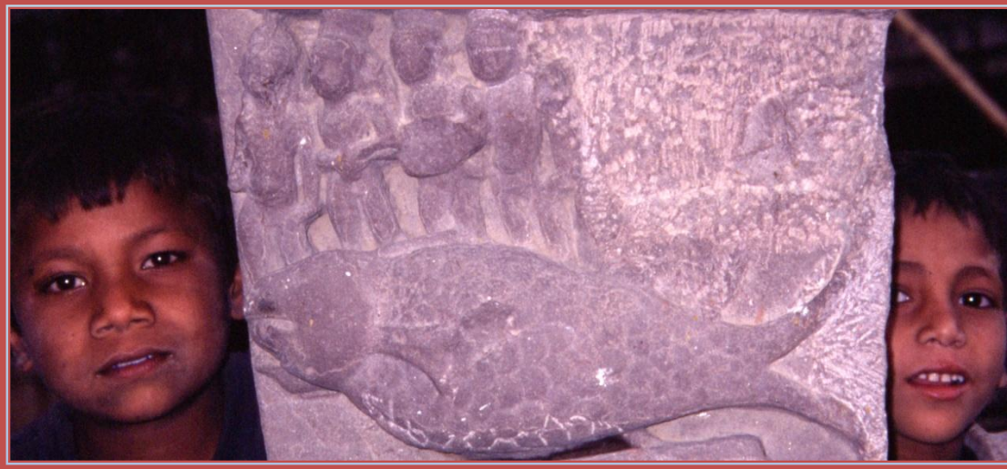
Matsyāvātāra (Viṣṇu in Fischgestalt) Exponat des archäologischen Museums von Gwalior, Madhya Pradesh, Indien (1997)