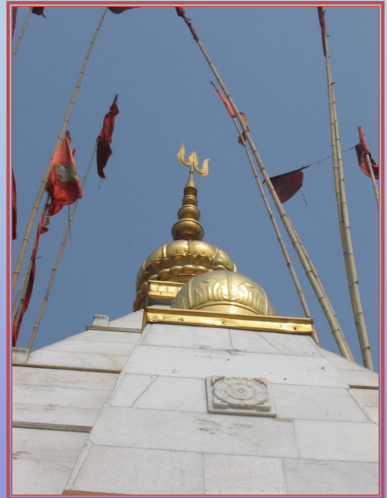
Tempelanlage Naina Devi, Himachal Pradesh, Indien (2008)