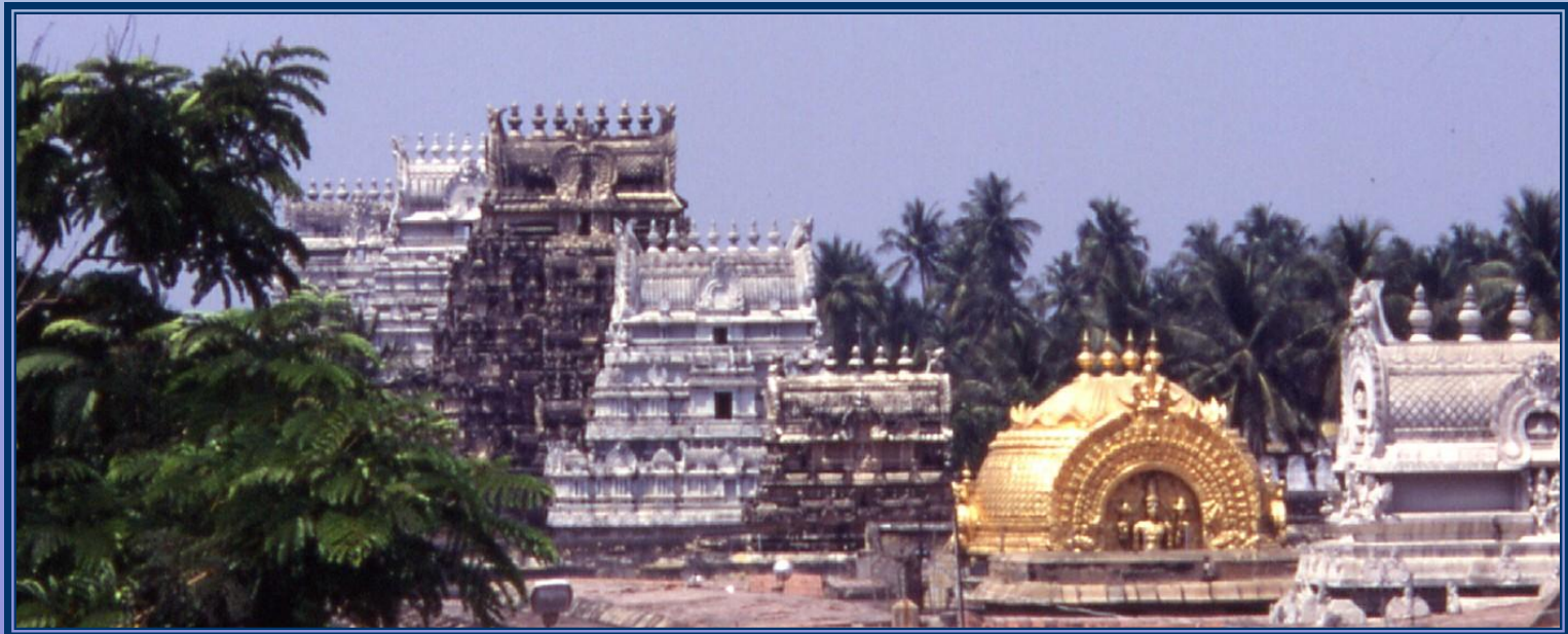
Tempelanlage Srirangam, Tamil Nadu, Indien (1997)