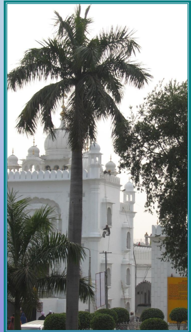
Gurdwara in Anandpur, Panjab, Indien (2008)